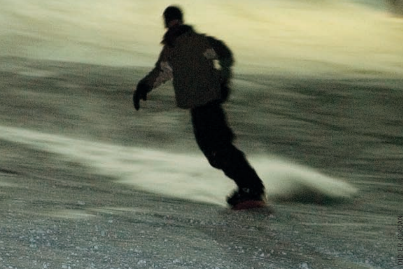
St-Cergue-Village, pistes éclairées